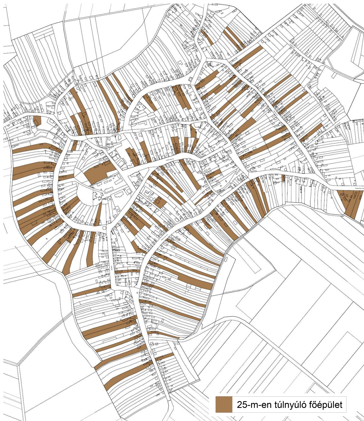
Főépület beépítettség vizsgálat I. – saját szerkesztés

A lakó- és főépület elhelyezése az előkert (általában 5,0 m) és a telek homlokvonalától mért 25 m-es sávon belül lehetséges. Gazdasági funkciójú melléképítmény elhelyezése e távolságon túl lehetséges. A helyszíni bejárás alapján megállapítottuk, hogy a 25 m-es mélység több helyen is túlépítésre került. A vizsgált tömbökben azt is megállapítottuk, hogy a további tömbfeltárás, utcanyitás nem várható hosszú távon sem, ami a differenciált beépítés további akadályát képezné.